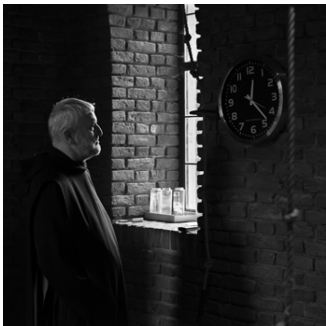
Broeder Ole in kloostergang bij de wandklok en kerkklok