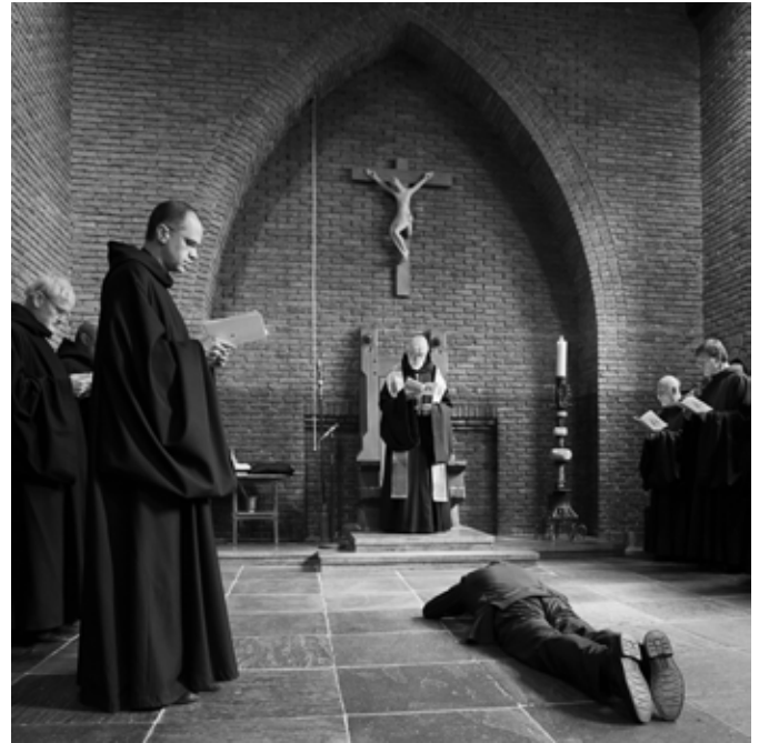
Inkleding novice in kapittelzaal