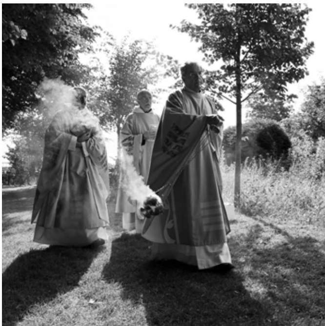
Intocht op de Adelbertusakker

Op 26 juni 2016 ben ik, wederom op de Adelbertusakker om zeven uur 's ochtends met deze nieuwe fotoserie gestart. Het was een prachtige dag, de opkomende zon scheen op het altaar. Het was nog