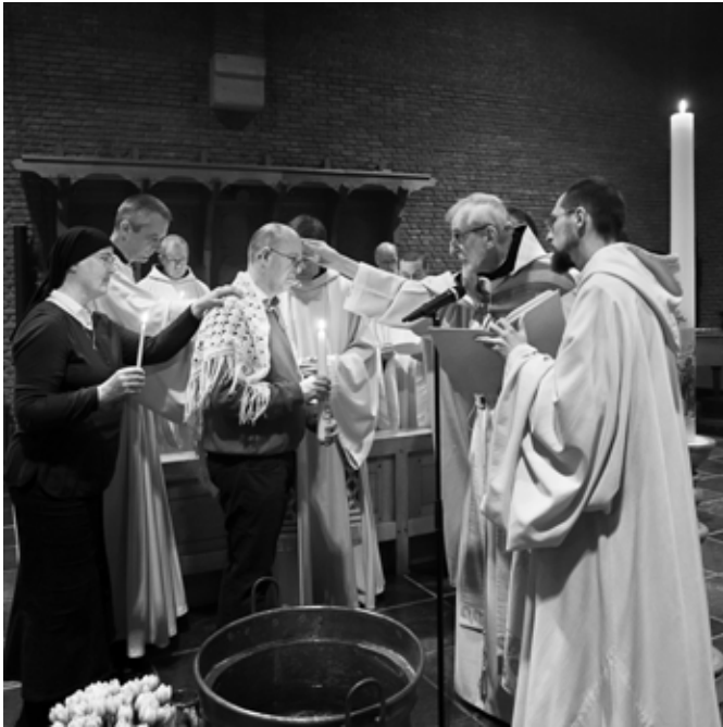
Zalving tijdens paaswake