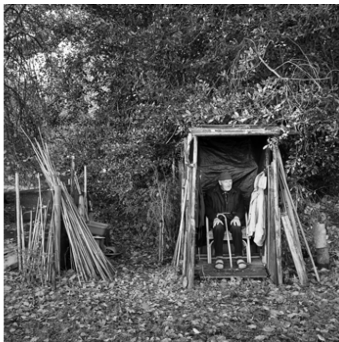
Broeder Cor bij het weiland